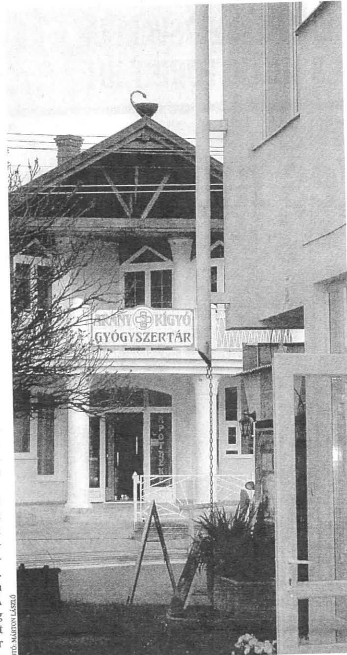
Kör-kép. Alig ötven méterre lesz egymástól a két patika

A polgármester kifejtette: évekkal ezelőtt az egészségház és Lelle vezetésével közösen egyeztetni szerettek volna a patikusokkal, de egyetlen gyógyszerész sem ment el a találkozóra. Ezek után került az új patika a boglári beruházás tervei közé. A pályázat előszöri kiírásakor még mint kötelező elem, majd bent maradt az új körben is, bár ekkor a gyógyszertár már csak opcionális lehetőségként szerepelt.